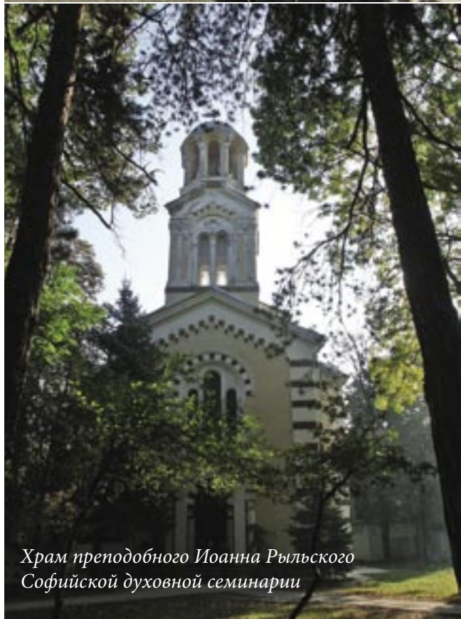
Храм преподобного Иоанна Рыльского Софийской духовной семинарии