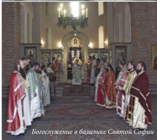
Богослужение в базилике Святой Софии