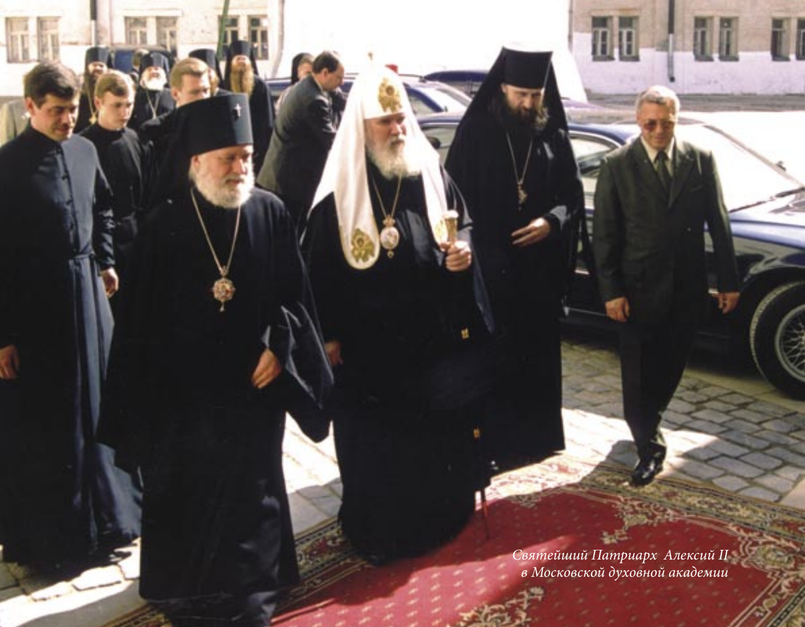
Святейший Патриарх Алексий II в Московской духовной академии