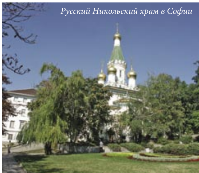
Русский Никольский храм в Софии