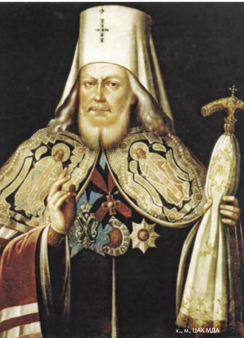
Х., м., ЦАК МДА

Отцами новой эпохи духовного образования стали Московские митрополиты Платон (Левшин) и Филарет (Дроздов). Для рождающегося детища – русского