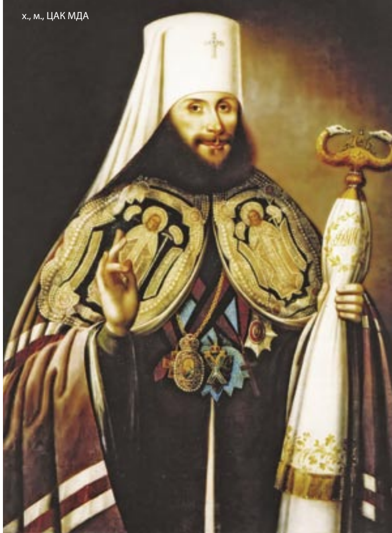
Митрополит Московский и Коломенский Филарет (Дроздов) (1821-1867)

Для выхода Академии на уровень систематической церковной науки необходима была коренная реформа духовного образования. Осуществил итоговую