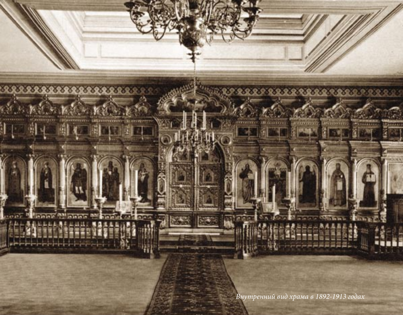
Внутренний вид храма в 1892-1913 годах