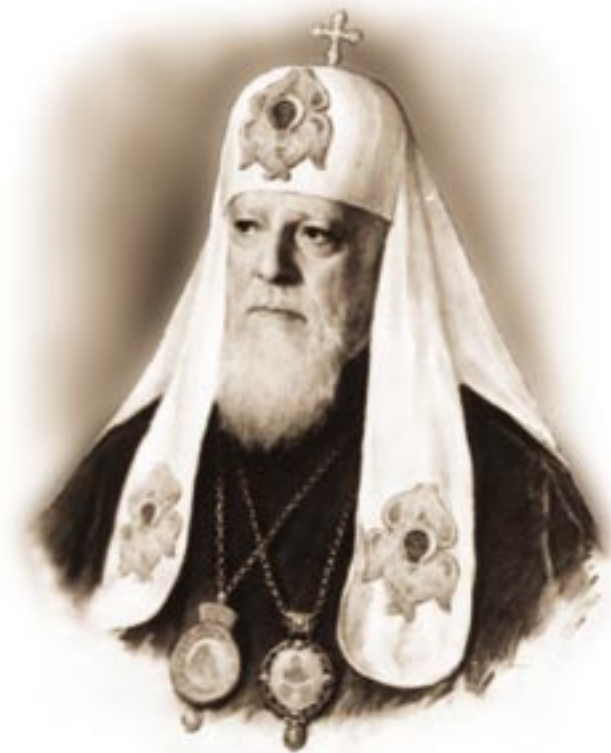
Святейший Патриарх Алексий I

Каждый, кто вступает ныне в Академический храм, проникается его благолепием. В дивную гармонию слились здесь древние иконы, иконы современного письма и настенная роспись. Иконостас, несколько необычный, торжественный и стройный, всякий раз невольно привлекает внимание проходящих в храм на молитву. Непосвященному довольно трудно распознать, что здесь создано в наше время, а что написано иконописцами далекого прошлого. Происходящий из разрушенной в 1935 году московской церкви преподобного Харитона Исповедника и воссозданный в Лавре иконостас Покровского храма хранит ряд древних икон, достойных самого пристального внимания и изучения. Несколько