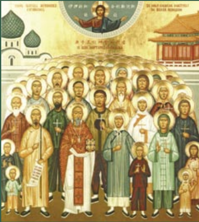
Икона 222 мучеников китайских

Впредначати вечной радости сияющие, примите от нас недостойных венки похвалы, сплетенный из воспоминаний о вашей доброй жизни и славной кончине! Ты, иерей Божий, Митрофан Цзи, первым из туземцев призванный к пастырству, много потрудившийся над переводами богослужебных книг и примерной жизнью стяжавший себе уважение паствы; много также ты потрудился над ее духовным развитием, много скорбел о ней, болел душой за болезни других... Конец твой славен: грудь твоя, израненная копьями врагов Креста Христова наподобие пчелиного сота, источила нам сладостную уверенность, что ты всегда будешь усердным молитвенником о спасении душ твоей паствы, каким ты был во временной сей жизни. Супруга твоя, Татиана, бывшая диакониссой церкви, просвещала светом Евангелия китайских жен, подготавливая их ко святой купели; сама показала нам пример, как нужно страдать за исповедание веры, – несколько раз была мучима, влачима по дворам и обезглавлена. Павел Ван, ты