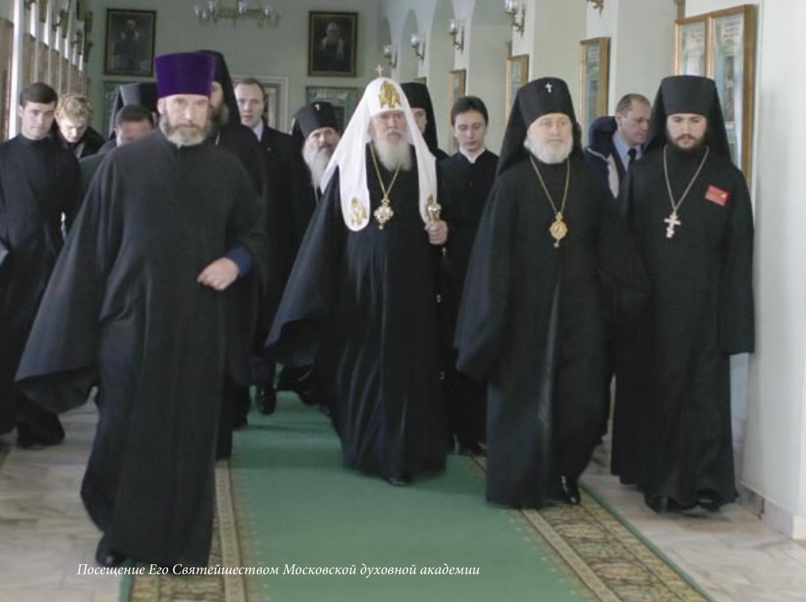
Посещение Его Святейшеством Московской духовной академии

мени. Церковь остро нуждалась в просвещенных служителях, которые могли бы вести диалог с обществом, ориентироваться в общественных процессах и влиять на них. Предстоятель Русской Церкви понимал, что богословское образование должно было стать школой вхождения в живой церковный опыт, подготовкой пастырей к свидетельству и служению в совершенно новых условиях.