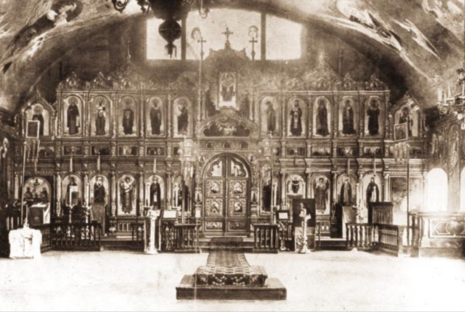
Внутренний вид Академического храма после преобразования в 1913 году