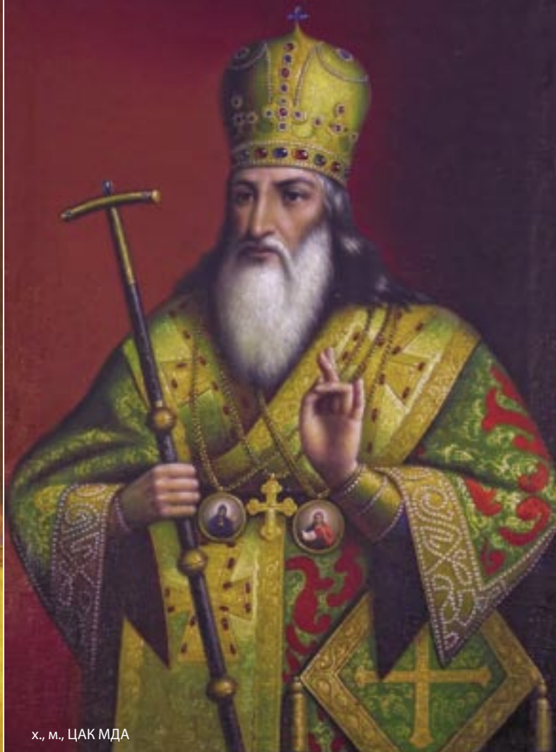
Святейший Патриарх Никон (1652-1666)