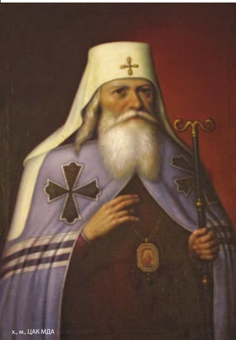
х., м., ЦАК МДА

Смена принципов образования в Московской академии началась с момента упразднения патриаршества в России. За несколько месяцев до своей смерти Патриарх Адриан по повелению царя рукоположил