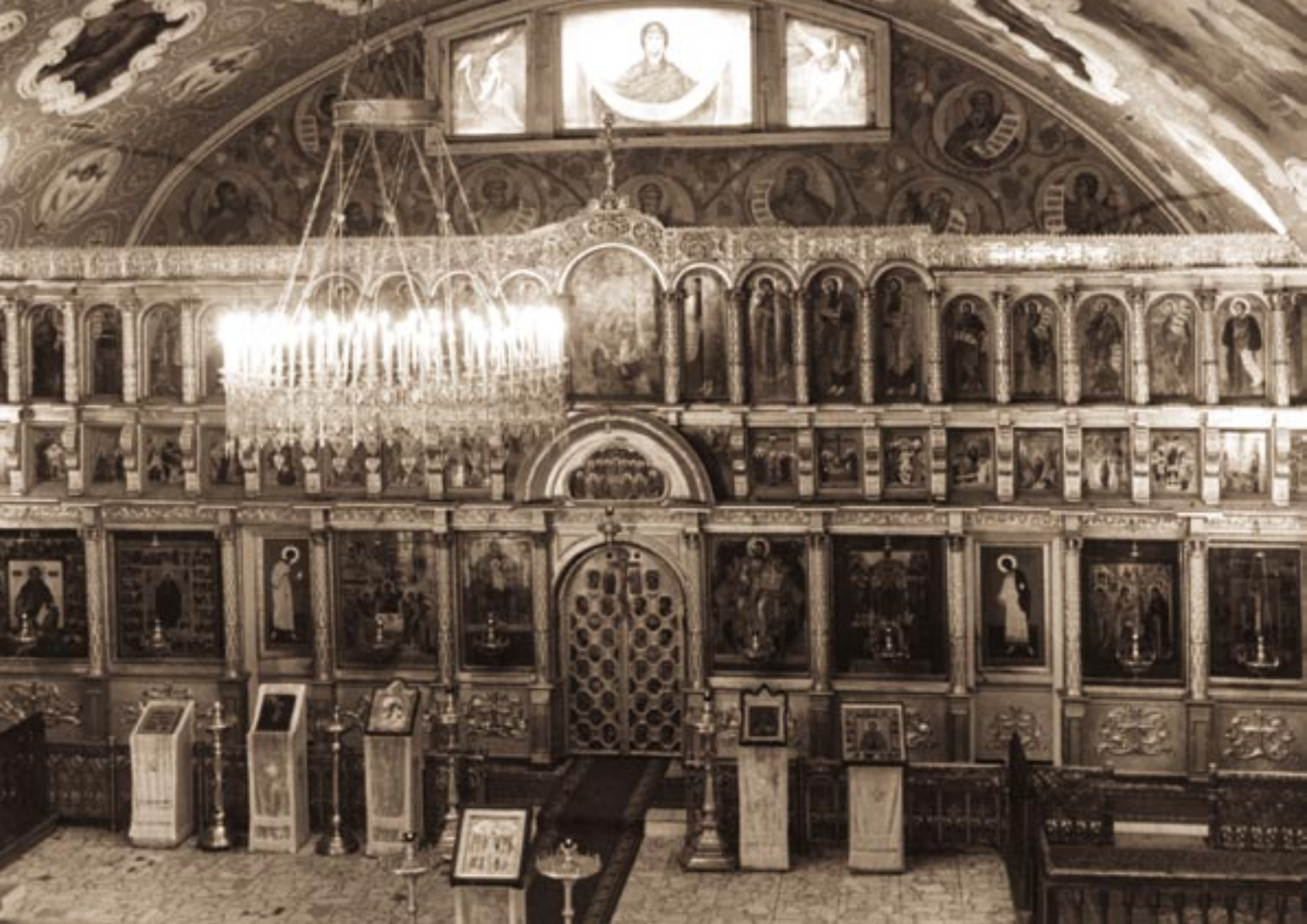
Внутренний вид храма после восстановления в 1955 году

диаконов, приглашать таковых для совершения богослужения из Лавры или из приходских церквей Сергиева Посада;