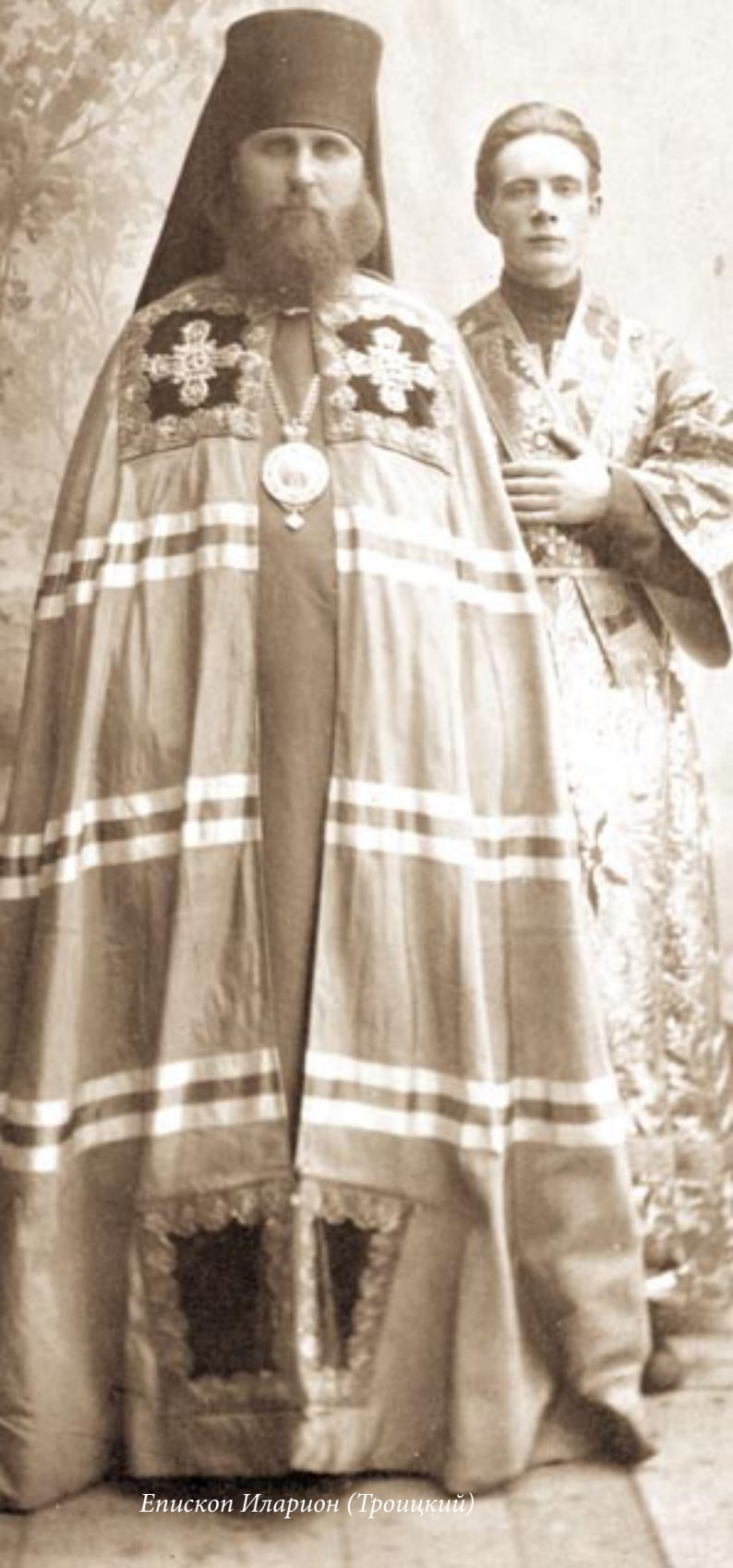
Епископ Иларион (Троицкий)

по возможности даже и не разговариваем между собою. А отсюда Академии как целого теперь не существует. В ней действительно спокойно, но спокойно, как на Шипке, если припомнить эту знаменитую картину».