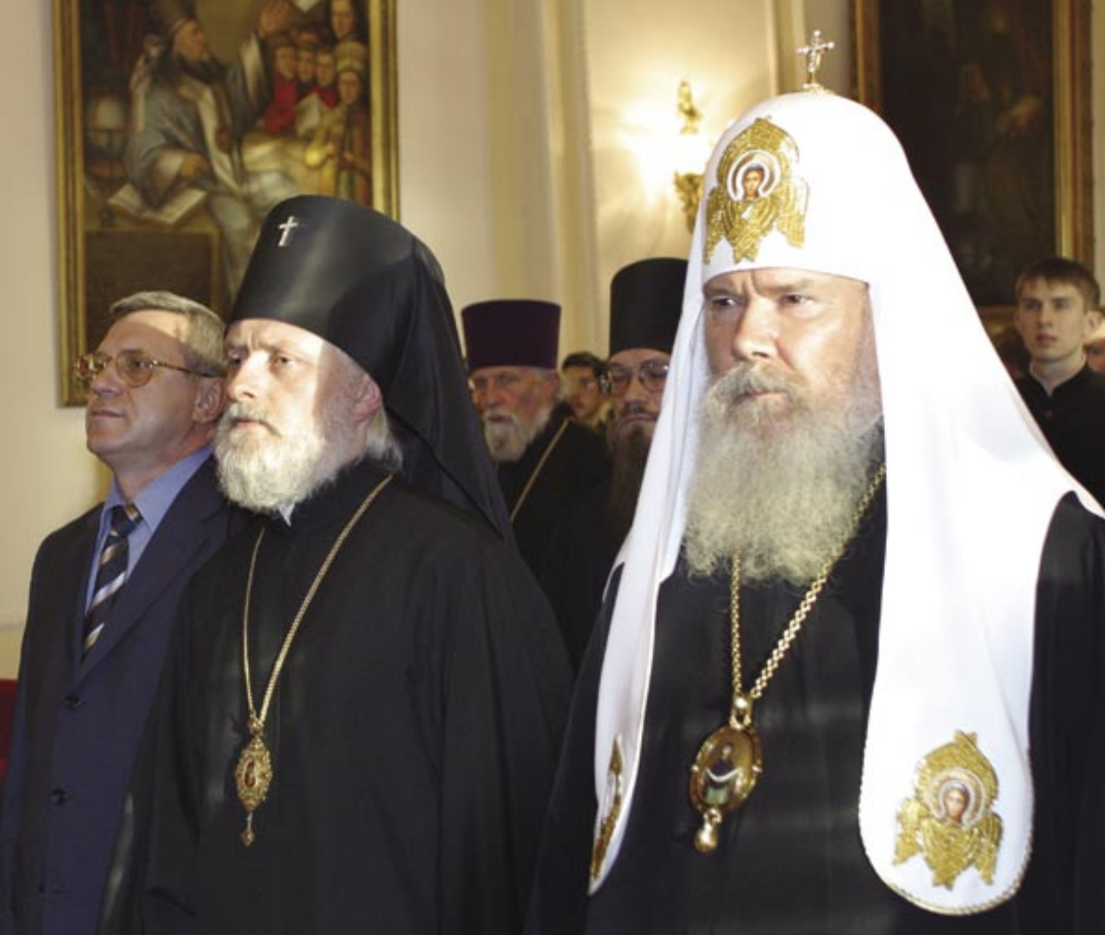
Святейший Патриарх в Академии в день престольного праздника

каких-то духовных школ это насущная проблема, для других – лишь отдаленная перспектива. Ясно, что в этом процессе должна быть постепенность, увязываемая с уровнем и состоянием семинарий. Так, многие духовные школы, вопреки действующему законодательству, до сих пор не прошли еще процесса государственного лицензирования. Но это обстоятельство не отменяет обязательности для всех духовных школ усилий по осуществлению реформы духовного образования.