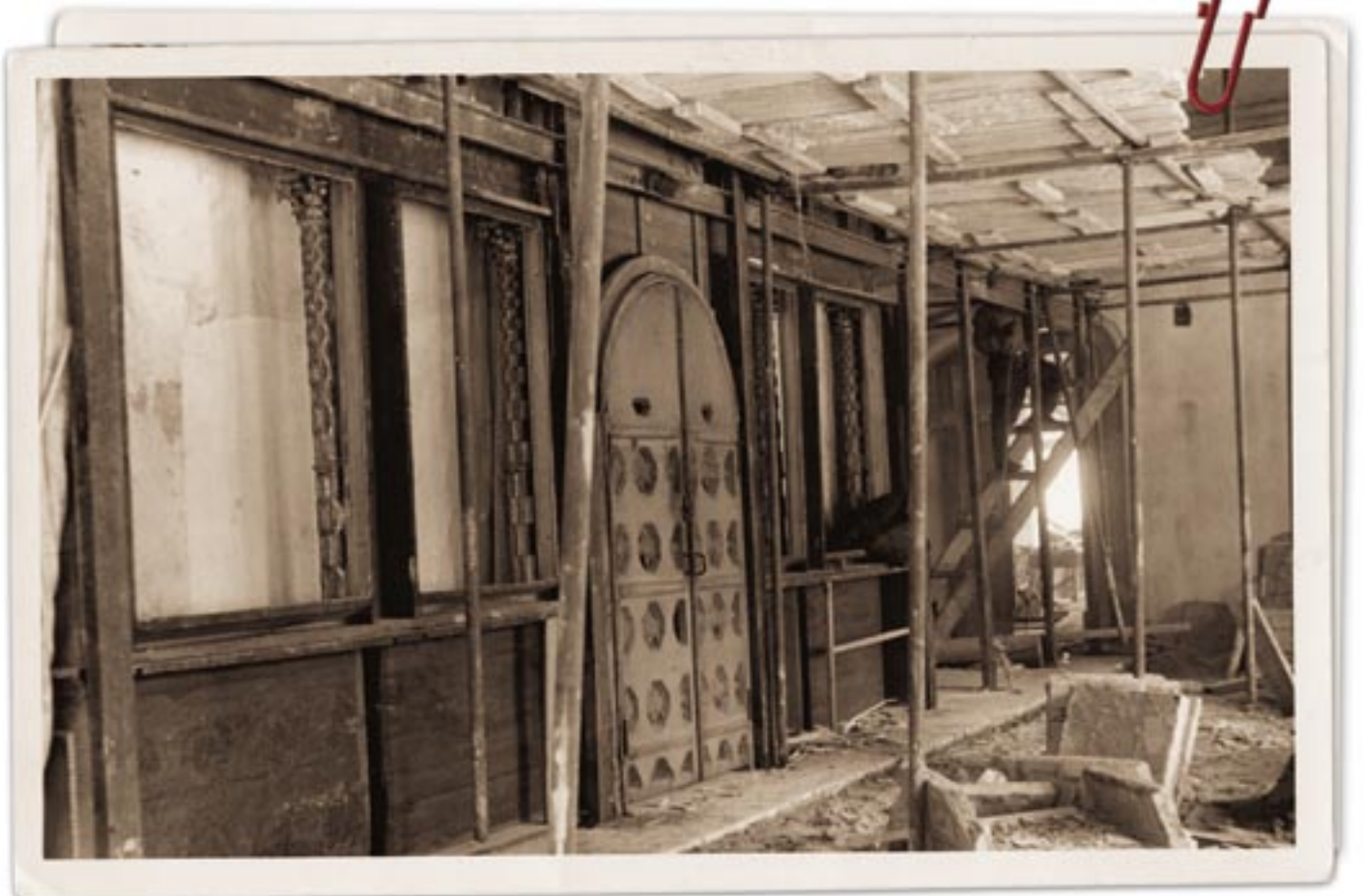
Алтарь Академического храма во время проведения восстановительных работ в 1955 году

Летом 1913 года по благословению митрополита Макария (Невского) и при его щедрой материальной поддержке Академия смогла приступить к преобразованию храма. Прежде всего были разобраны потолок и крыша и возведен полукруглый свод. Был сделан новый купол – над центром храма, и большое окно в восточной стене, отчего стало гораздо светлее. Работы закончились