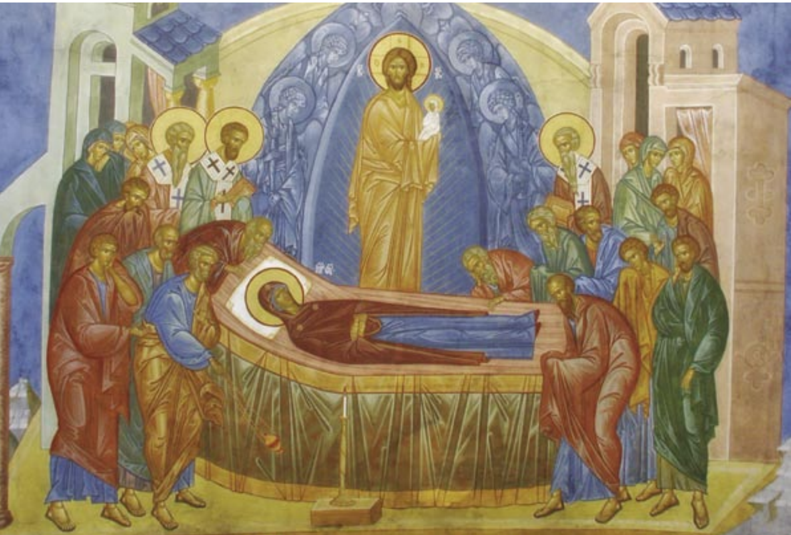
Фреска Успения Пресвятой Богородицы на сводах Академического храма