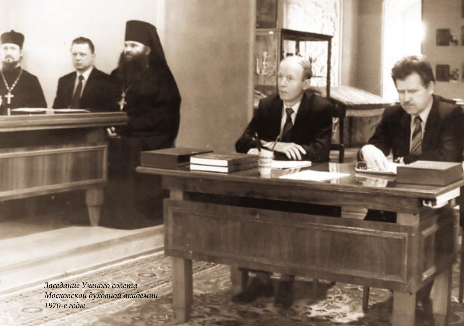
Заседание Ученого совета Московской духовной академии 1970-е годы