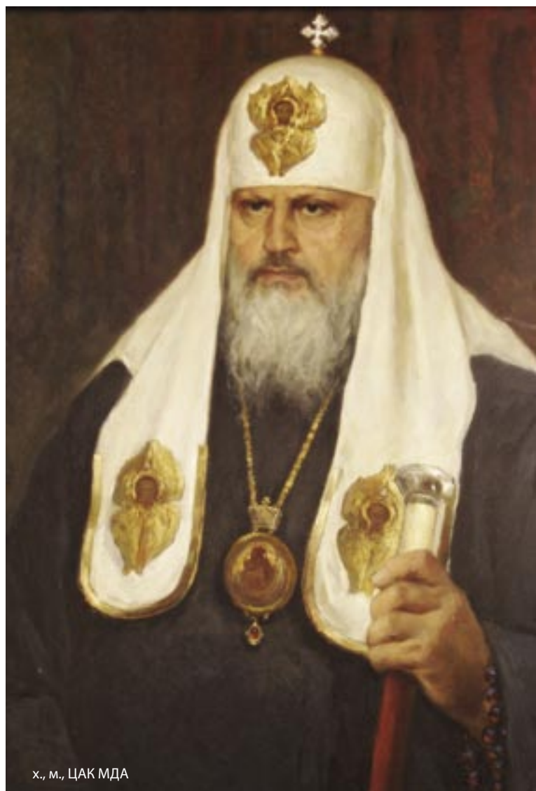
х., м., ЦАК МДА

Новый Патриарх Московский и всея Руси Пимен был хорошо знаком с Академией, ее жизнью и про-