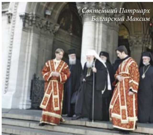
Святейший Патриарх Болгарский Максим