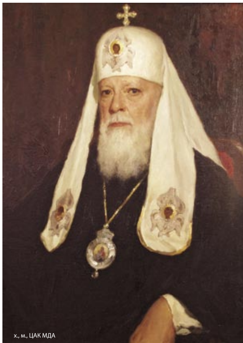
х., м., ЦАК МДА

Впервые после закрытия Московской духовной академии вопрос о ее воссоздании поднял Патриарший Местоблюститель митрополит Сергей (Страгородский) на встрече в Кремле с руководством страны во главе со Сталиным. Эту встречу можно с полным основанием назвать исторической, поскольку произошел перелом в отношениях с государством. Митрополит Сергей спокойно и