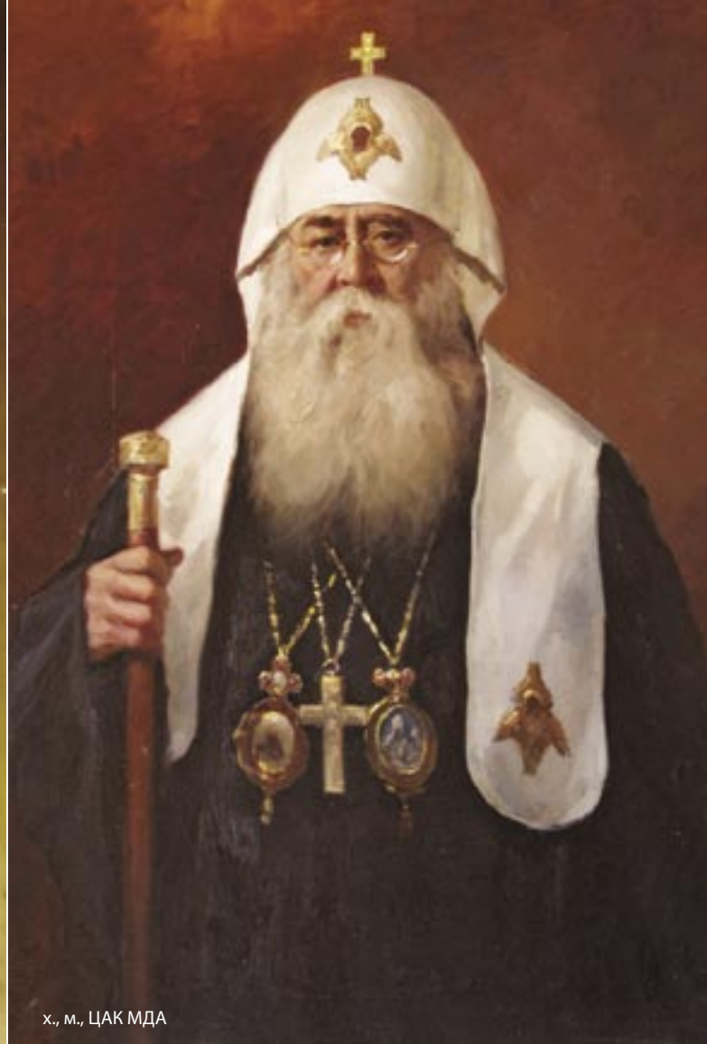
Святейший Патриарх Тихон (Белавин) (1917-1925)