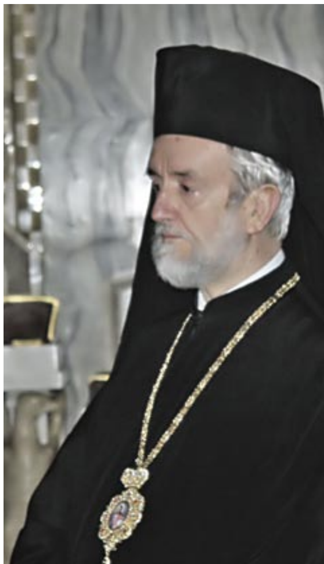
Митрополит Пергамский Иоанн (Зизиулас)

Если и есть сейчас сильные богословы, то их совсем немного и они не признаны в православной среде, их намного лучше воспринимают инославные, которые искреннее желают услышать ответы