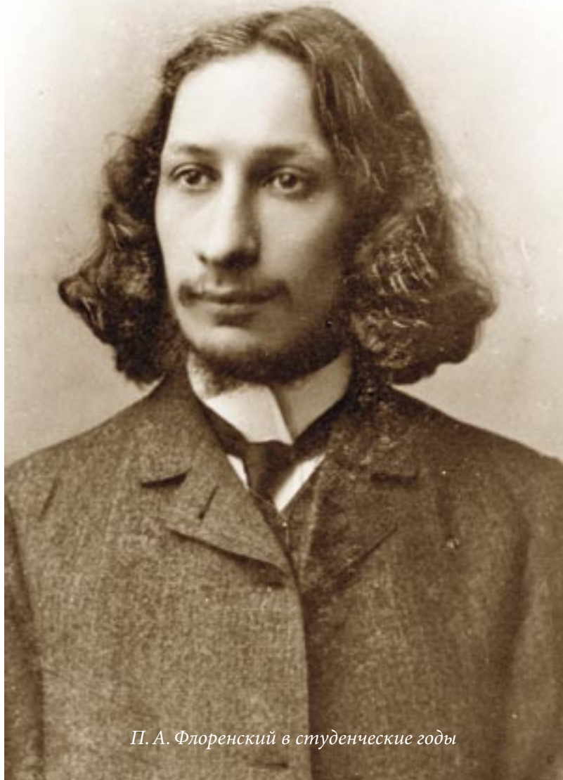
П. А. Флоренский в студенческие годы